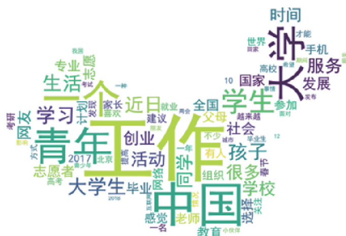
图2 网络诉求文本的词云分析

通过诉求文本的统计特性反映表达的充分性和翔实性。文本长度和均值统计分析结果为(均值/方差):文化兴趣(198.10/44.04),教育发展(264.87/46.56),健康医疗(190.27/46.32),政治权益(237.72/46.26),社会环境(192.09/46.91),就业创业(302.16/47.41),其他(154.81/55.29)。不同主题的诉求在信息表达和详细程度上差别不大。只有其他议题的文本长度均值较小(小于200字符)。可见,青年作为诉求的主体,在明确类别的主题上,信息掌握和表达能力都优于目标不明确的主题,诉求表达的目标感更强。