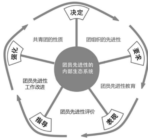
图1 “开放系统”中团员先进性的内部生态系统分析框架

在具体指标的设计上,本研究遵循以下基本要求:一是评价标准的数量化。尽可能地采用第三方和现有权威数据,提高评价指标的客观性和数据化水平。二是评价指标的科学性。确保评价指标满足效度、信度、及时、透明、可测和目标性的基本要求。三是评价指标数量的适合性。本评价体系的指标数量借鉴美国国家科学基金委员会(NSF)于2011年开始普遍采用的评价指