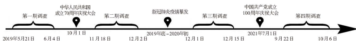
图1 上海高校“大学生党史国情认知调研”四次调查的时间轴

本研究所采用的数据来自笔者在上海市17所高校本科生中所进行的“大学生党史国情认知调研”的四次抽样调查 ① 。该调查的时间跨度是2019-2021年,期间经历了中华人民共和国成立70周年和中国共产党成立100周年等重大时间节点,以上海市的高等学校为主确定调研学校,选取每所学校开设的思想政治理论课教学班,对所选取的班级进行整体抽样。四次调查回收有效样本分别是1172份、1396份、1104份和1194份(具体时间见图1),共计4866份。